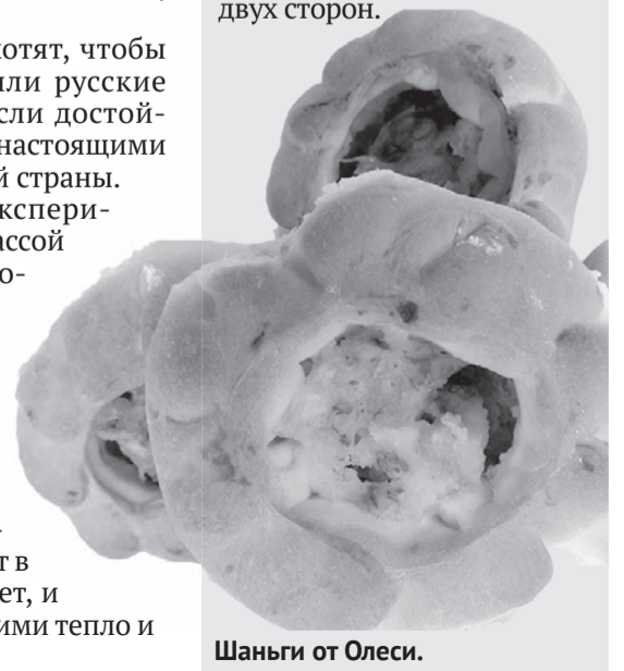
Шаньги от Олеси.

Предварительно завести опару из небольшого количества муки, дрожжей и молока, поставить в теплое место, чтобы тесто поднялось. Смешать муку, яйца, молоко, сахар, соль, немного сала, добавить в смесь готовую опару. Хорошо вымесить, дать тесту подняться. Полученное тесто разделить на пряженики. Куски теста выхлопать в каталке, посыпанной мукой. Тесто из каталки выложить на стол, дать подняться, потом растянуть руками до круглой формы, опустить на сковороду в кипящее масло и жарить, постоянно переворачивая деревянными лопатками, до золотистой корочки с двух сторон.