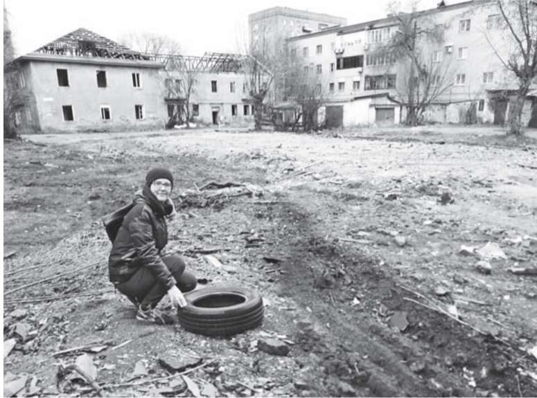
Двухэтажку из центра Орска вывезли на полигон, расчистив территорию.

В центре Орска на улице Горького вместо дома № 14 теперь свободное пространство. Здесь не осталось ни щепки, ни кирпичика, и только желтые газовые трубы напоминают о когда-то жилом здании. На пересечении переулка Зеле-