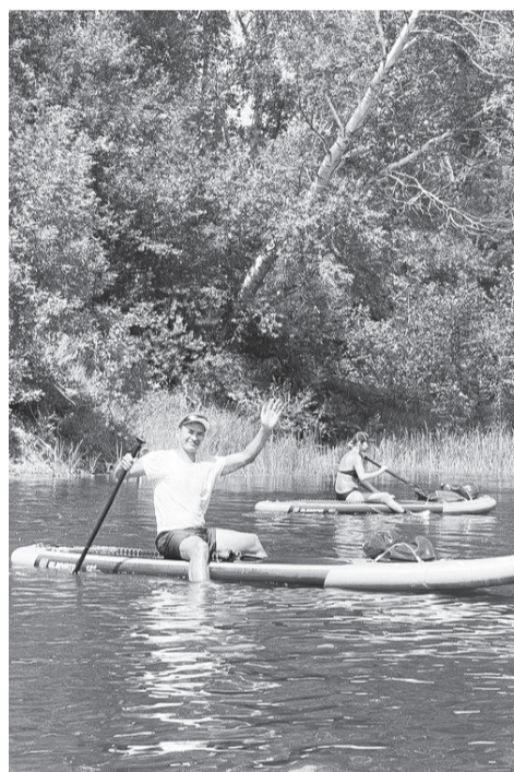
Ограничения по здоровью туризму не помеха!

А вот областная организация Всероссийского общества инвалидов в конкурсном отборе на получение поддержки министерства социального разви-