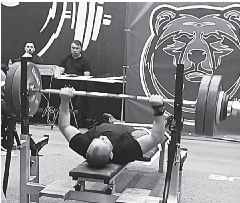
Каждый взятый вес – маленькая победа над судьбой.