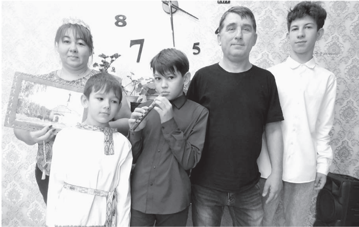
В семье чтят традиции предков.

- Там, откуда муж родом, практически одни русские, - поясняет хозяйка дома. - Редко можно встретить казаха или башкира. Они только в последнее время стали приезжать туда, и то в основном это врачи. Мне очень нравится в Вологодской области - невероятно красивые леса, настоящие чащи, прекрасный чи-