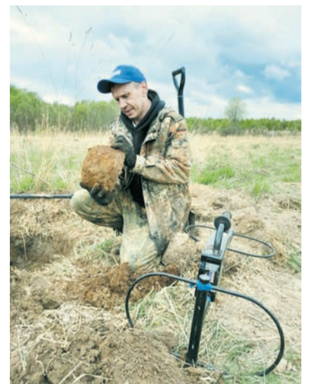
Поисковые работы в Калужской области на территории деревни, сожженной в 1941 - 1942 гг.

Ребята из Оренбургского поискового отряда в уходящем году приняли участие в двух экспедициях в Волгоградской области и Краснодарском крае. Первая была приурочена к 80-летию окончания Сталинградской битвы. Она объединила около 400 поисковиков из разных регионов страны. Оренбуржцам удалось поднять останки восьми бойцов, у двоих были медали, но они оказались пустыми. Вторая – «Вахта Памяти-2023. Битва за Кавказ» – это мероприятие, организованное Межрегиональной профсоюзной организацией «Газпром профсоюз», ООО «Газпром трансгаз Краснодар» и ОППО «Газпром трансгаз Краснодар профсоюз». Она объединила более 100 работников из 42 дочерних компаний ПАО «Газпром». Оренбургские поисковики обнаружили останки шестерых бойцов.