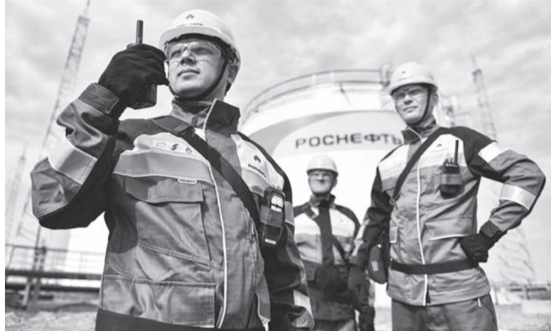
Устойчивое развитие предприятия - залог стабильности и процветания региона.

были найдены керамический сосуд, бронзовый боевой топорик, лепешки из охры - это ранний бронзовый век, бронзовый нож и древний туесок - поздний бронзовый век. Совершенно уникальными находками стали боевые мечи и фаянсовая шкатулка. Сейчас эти предметы находятся в археологической лаборатории ОГПУ.