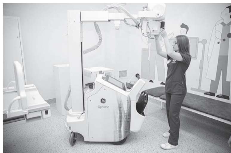
Медперсонал осваивает современную аппаратуру.

Весь дизайн помещений выполнен в ярких, но приятных тонах, а с потолка свиса-