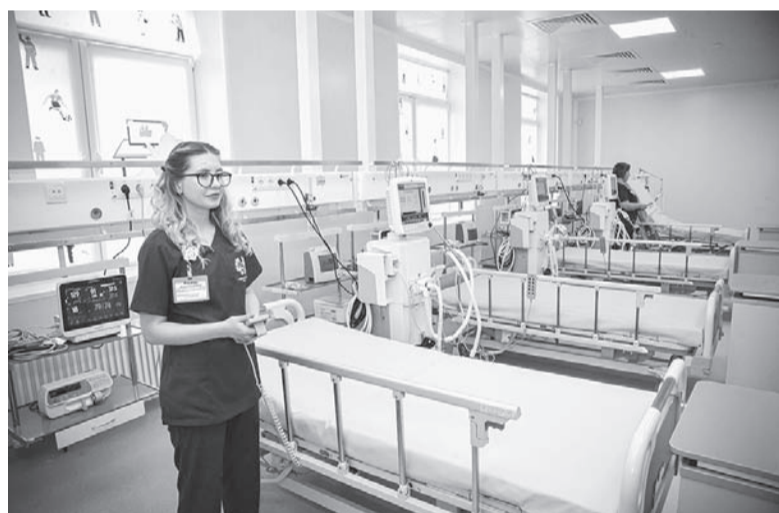
В лечении детей помогут «умные» приборы.

Помните, в классических американских сериалах в коридорах были открытые палаты, огороженные шторками? В приемном отделении новой больницы - мягкие ограждения, но из медицинской ткани, обладающей антибактериальной активностью. Обычные палаты тоже есть. Они закрытые, одно- и двухместные.