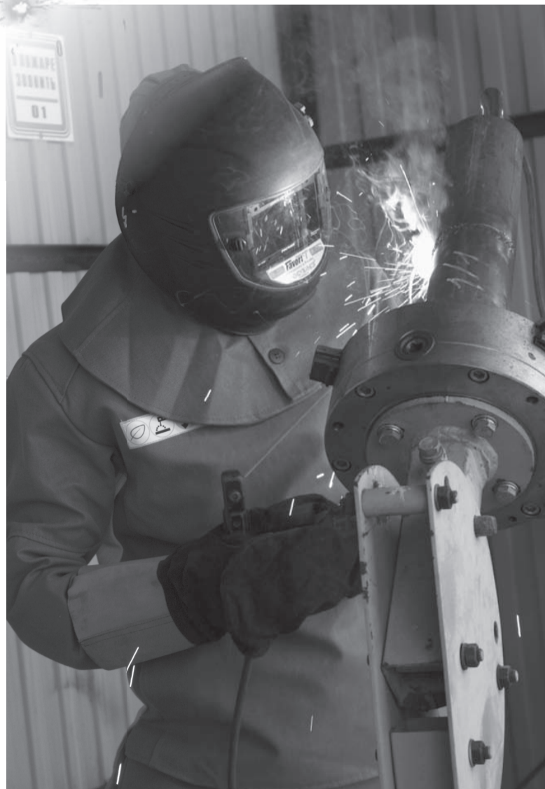
Только потом можно «искры метать»!