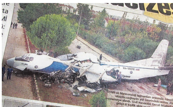
Потерпевший крушение Ан-26 в аэропорту Анталы: фото из турецкой прессы от 9 ноября 2002 года.