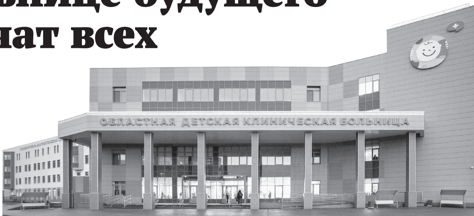
Новый медицинский комплекс объединил три стационарных подразделения.

Вы где-нибудь видели рентген-аппарат со встроенным экраном, на который сразу выводится изображение? А мы видели. Врачи похвалились и новеньким аппаратом КТ. Оборудование передает самое точное и детальное изображение.