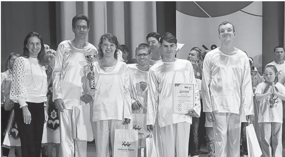
С Международного благотворительного танцевального фестиваля «Inclusive Dance» новотроицкая группа «Движение вверх» вернулась с золотым кубком.

Как и новотроицкие инвалиды, дошкольная образовательная организация «Детская академия развития» из Оренбурга попала в число получателей областной субсидии впервые. С 2019-го она специализируется на помощи ребятишкам с психическими и речевыми