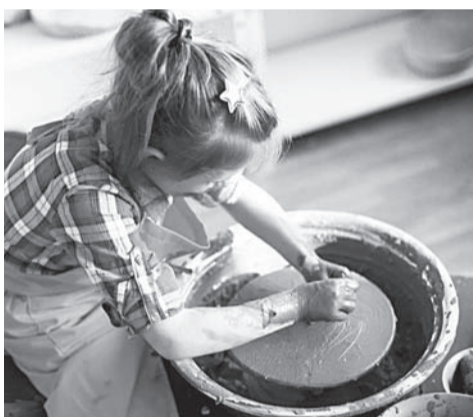
Гончарная студия раскрывает юные таланты.

С 2015 года из средств областного бюджета финансовая поддержка предоставлена социально ориентированным некоммерческим организациям на реализацию 43 социальных проектов и 11 социальных программ на общую сумму 65,9 миллиона рублей. В 2023-м министерство социального развития провело четыре конкурса, по итогам которых субсидия в общем объеме 9,2 миллиона рублей была распределена между 8 организациями-победителями.