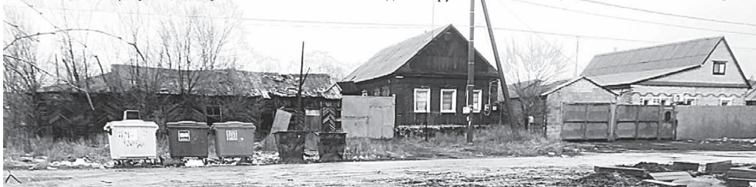
В частном секторе поселка Первомайский начали подготовку фундамента под мусорную площадку.

Всего в Орске на учете находится 641 площадка для сбора мусора: 128 соответствуют СанПиН, 123 благоустривают сейчас, 390 требуют ремонта. Всего установлено 2 442 контейнера для накопления ТКО, из них 85 «лодочек», 263 контейнера заглубленного типа, 720 цветных баков для раздельного сбора сырья, 1 374 металлических контейнера.