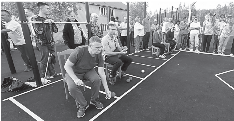
Есть игры, доступные каждому.