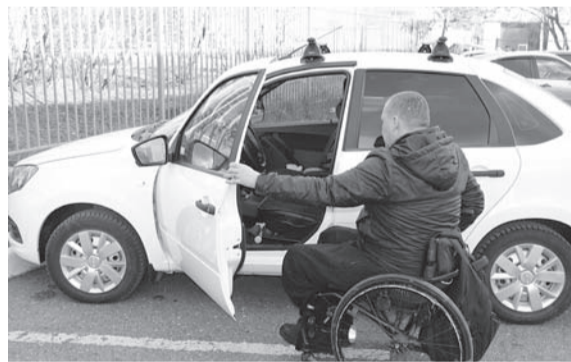
Поддержка людей с ограниченными возможностями здоровья осуществляется на программной основе.

По данным регионального минсоцразвития, в 2023-м уже закуплено 3 445 единиц технических средств реабилитации, приобретаемых по государственной программе «Доступная среда»: в том числе и таких дорогостоящих, как динами-