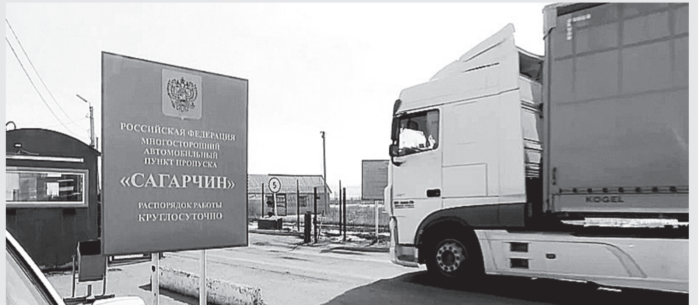
Пункт пропуска работает круглосуточно.

«Газпром добыча Оренбург» и АО «Новотроицкий завод хромовых соединений». Неизменным спросом у южных соседей пользуется продукция наших предприятий пищевой и перерабатывающей промышленности. По данным регионального министерства экономического развития, орское ООО «Желен» более десяти лет поставляет в РК колбасные изделия и мясные полуфабрикаты, птицефабрики «Оренбургская» и «Гайская» экспортируют в Казахстан куриное яйцо, ЗАО «Хлебопродукт-2» - муку и отруби, ООО «А7 Агро» - кукурузу, ОАО «Оренбургский комбикормовый завод» - соответствующий комбикорм... Перечислять можно и дальше, но понятно, что существующие связи нужно поддерживать, развивать и заодно создавать новые. Граница нам не помеха!