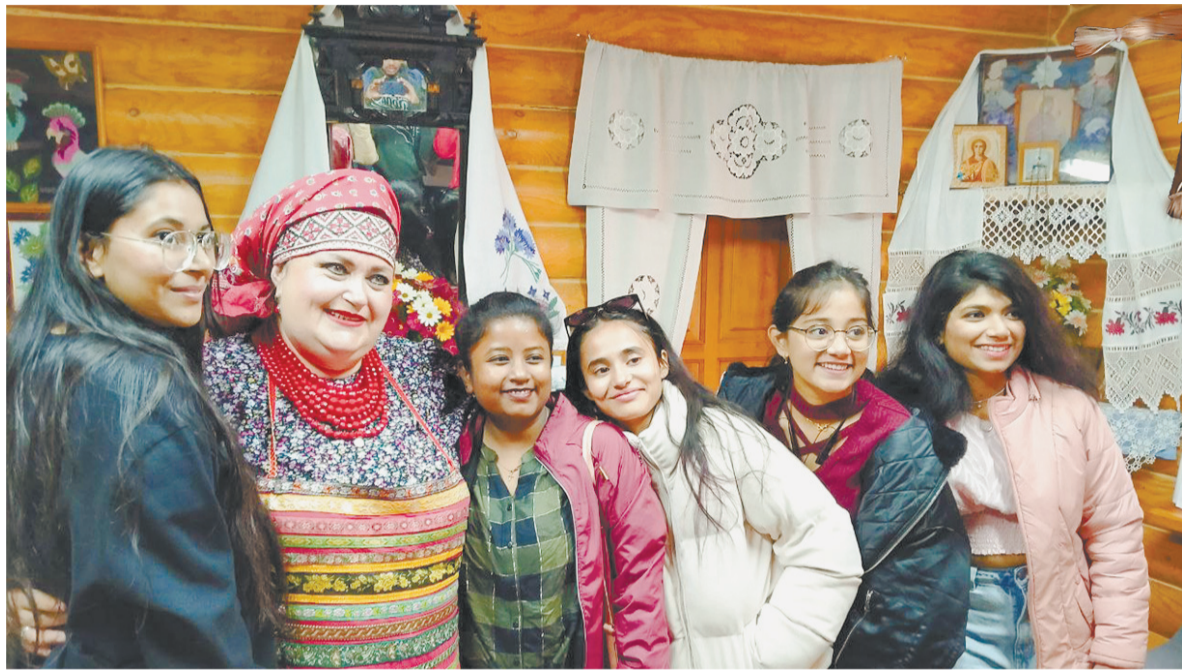
В русской избе всем рады!