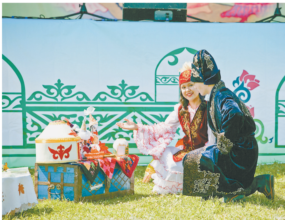
Подарки из бабушкиного сундучка.