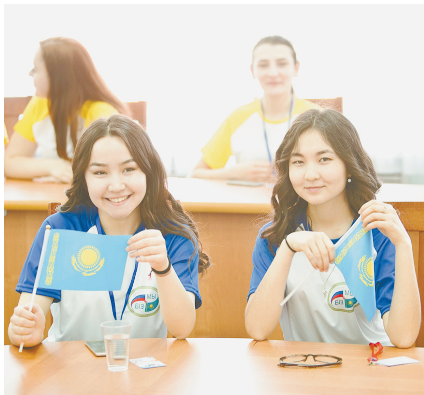
Встреча на российско-казахстанском молодежном форуме.