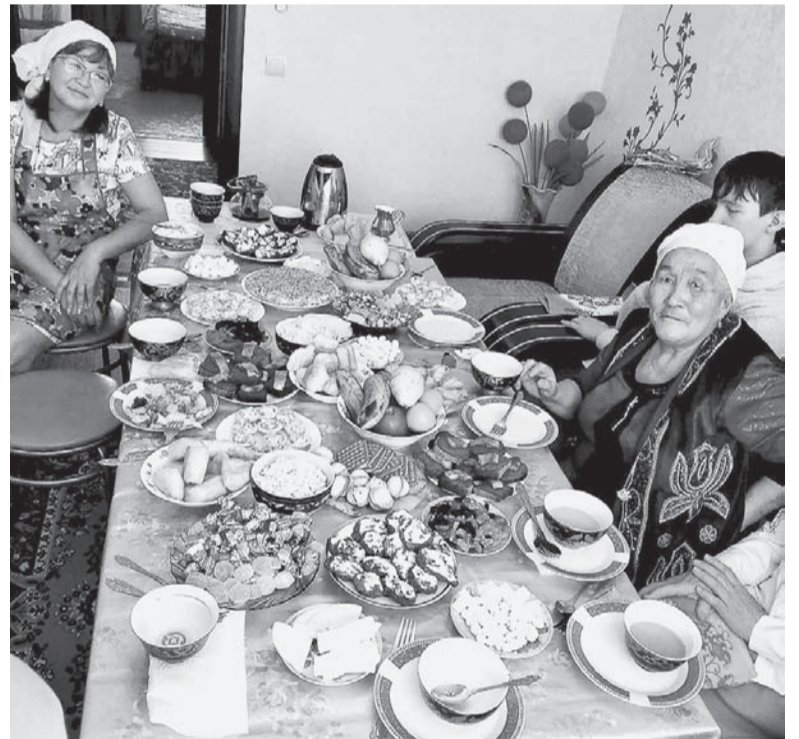
А вот такой богатый стол казахи накрывают к чаю!

всем понравилось. Сейчас у молодых стало модно совершать обряд никах, получать благословение муллы и свидетельство о браке, заключенном по мусульманским правилам. Наши новобрачные в мечети побывали на родине невесты в Саракташе, а свадьбу сыграли в Бузулуке.