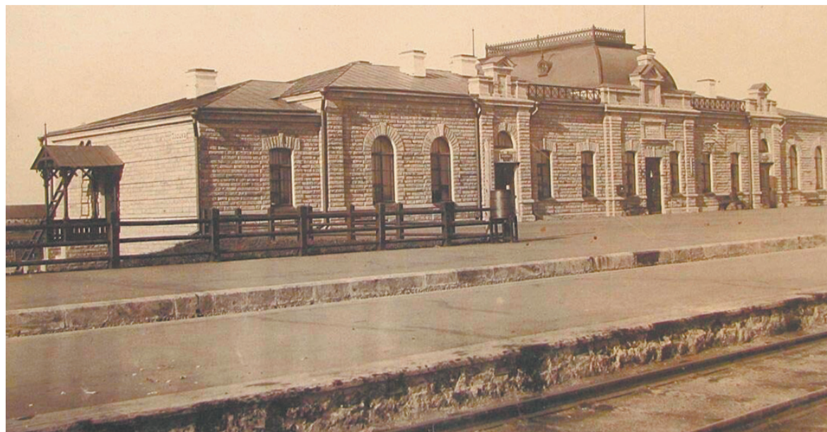
Станция Илецк-1. 1903 г.

Пока пассажиры не могут покинуть вагоны, поезд «берут» в пограничный контроль. Граница обязывает... Воротами в Азию станция Илецк-1 стала в конце 1960-х. История началась с 1900 года, когда правительством России было принято решение о строитель-