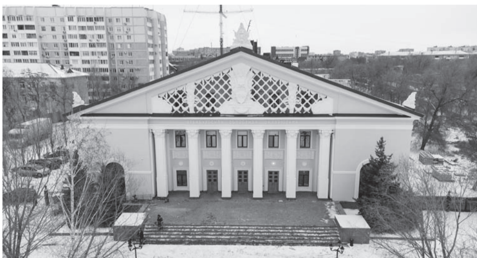
После длившейся полтора года реновации областная филармония открыла свои двери для зрителей.

тисты и музыканты, Рихтер, Магомаев, Синявская, Ростропович, оркестры Лундстрема и Спивакова, нужно было не просто отремонтировать, но и создать новые возможности для этой площадки, - сказал на торжественной церемонии открытия губернатор Оренбуржья Денис Паслер. - Музыкальное оборудование, которое мы приобрели, позволит принимать здесь не только академические коллективы, но также эстрадные и театральные. Я невероятно рад, что нам удалось воплотить этот проект! Наша филармония, а это коллектив в 300 человек, вернулась домой!