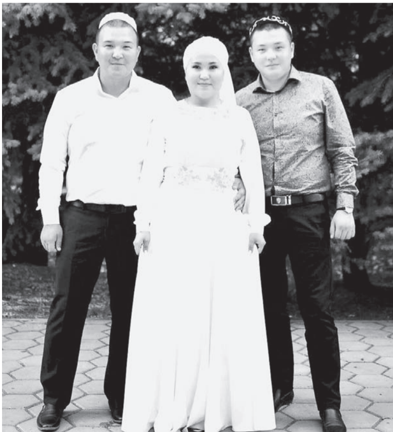
Неважно, какими обрядами сопровождалась свадьба, главное, чтобы дети были счастливы!