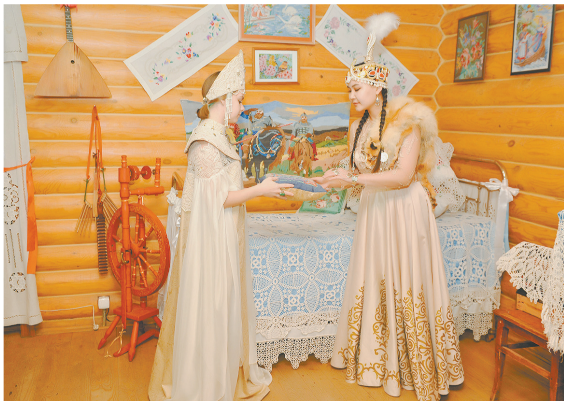
В «Русском подворье» гостям всегда рады.