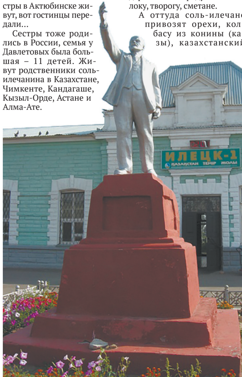
Приезжающих встречает памятник Ленину.

А оттуда соль-илечане привозят орехи, колбасу из конины (казы), казахстанский