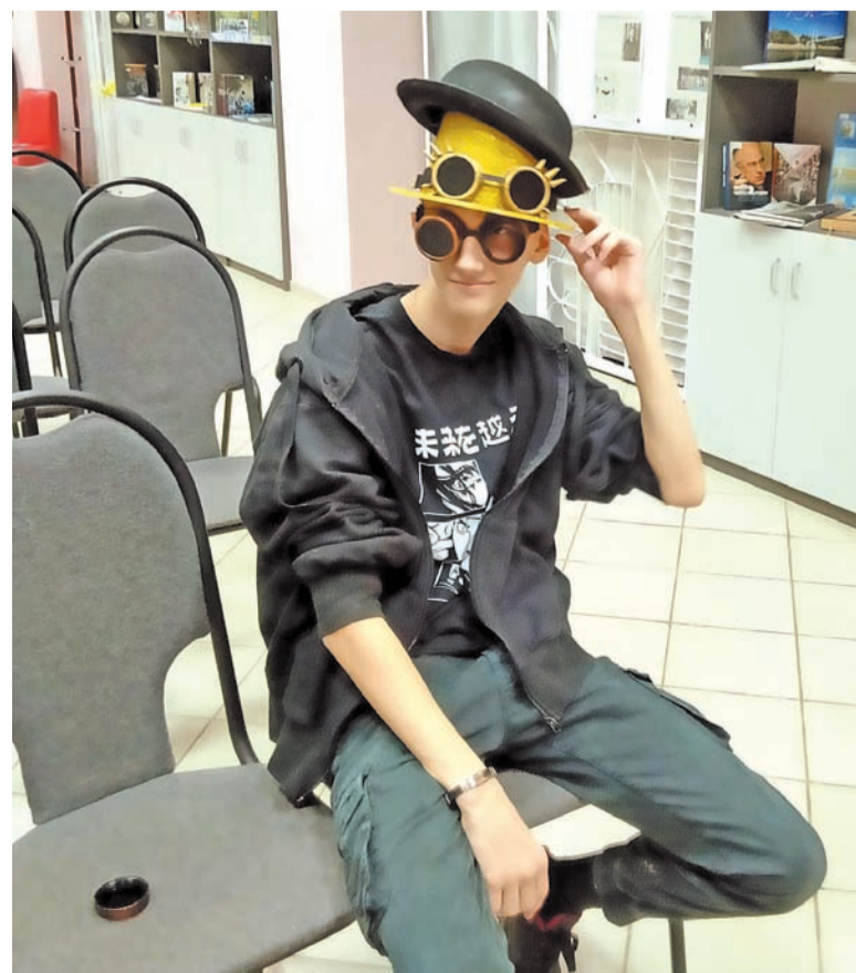
Для полета фантазии нужны очки, и шляп мало не бывает!