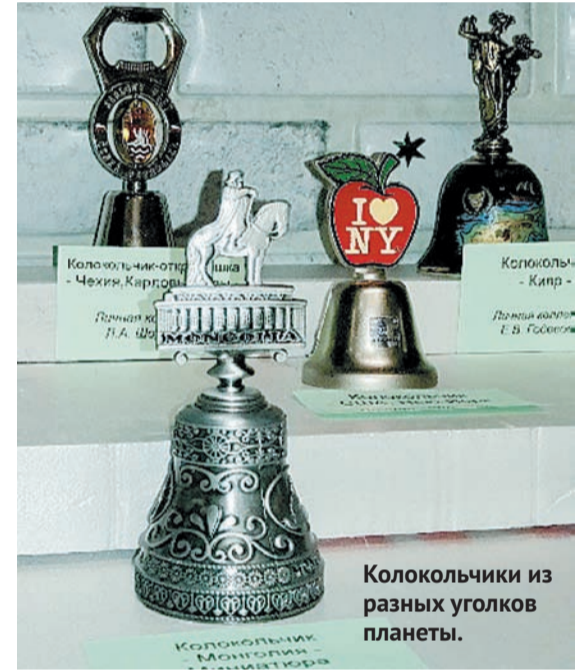
Колокольчики из разных уголков планеты.

Звуки колокольчиков по праву считаются голосами природы, ведь они изготавливаются из глины, металла, хрусталя. На выставке можно увидеть и услышать перезвоны бубенцов из разных городов России и многих стран мира. Экспонаты разделены по тематике: «Миниатюра», «Религия», «Флаги и гербы», есть эксклюзивные экземпляры.