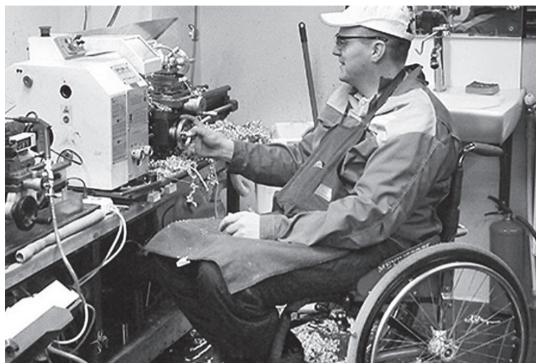
Оренбуржцы с ограничениями по здоровью могут обратиться в поисках работы в службу занятости региона.

В базе службы насчитывается 970 предложений для людей с инвалидностью или с ограниченными возможностями здоровья. Так, программиста ждут в Центре социальной поддержки населения в Грачевском районе и Сорочинском городском управлении ветеринарии, бухгалтера – в СПК «Рассвет»