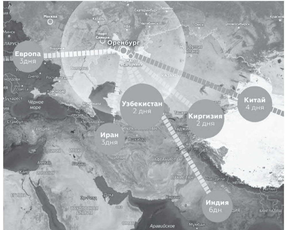
Схема примерных маршрутов и сроков доставки грузов из нового терминального комплекса на территории ОЭЗ «Оренбуржье» (на ул. Тихой в областном центре).

- В РФ пока ощущается их нехватка, но в Казахстане, по мнению экспертов логистической отрасли, ситуация куда