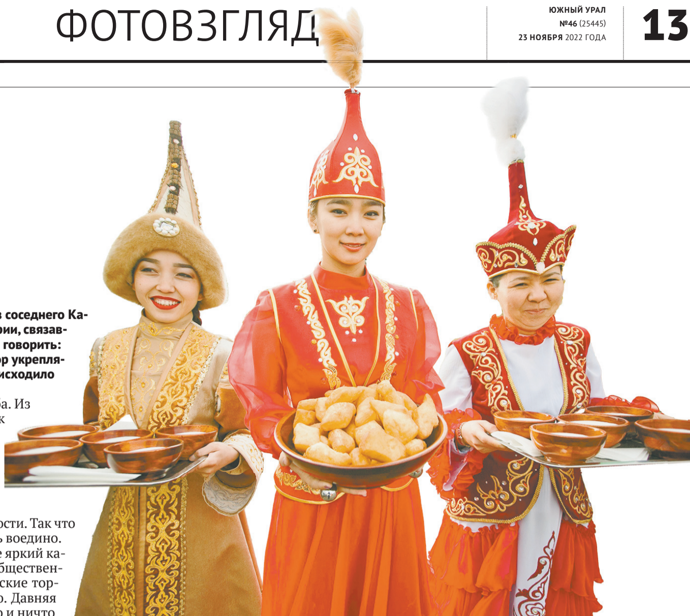
Какой прием без угощения!

Но и в повсеместном быту, и в дни праздничные яркий казахстанский колорит неизменно присутствует в общественной палитре нашего края. А национальные казахские торжества широко отмечаются по всему Оренбуржью. Давняя история дружбы и братства продолжается! И никто и ничто не в силах нас разобщить.