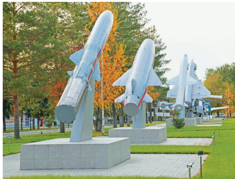
В музее под открытым небом представлены изделия, которые в разные годы изготавливали на ПО «Стрела».

Линейку продукции предприятия продолжает изделие, которое занимало особое место в производственной деятельности завода. Беспилотный самолет-мишень Ла-17, разработанный КБ им. С. А. Лавочкина, управлялся по радио и выполнял в полете маневры как по заданной программе, так и при помощи оператора. Кроме основного назначения мог использоваться в качестве прифронтового фоторазведчика и стал по сути «прародителем» современной беспилотной техники. Ла-17 изготавливался на объединении 30 лет, с 1962-го! Всего было выпущено 17 400 самолетов-мишеней.