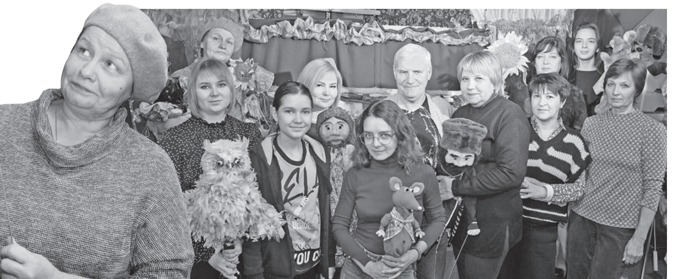
Вместе весело играть! Не в куклы, а с куклами.