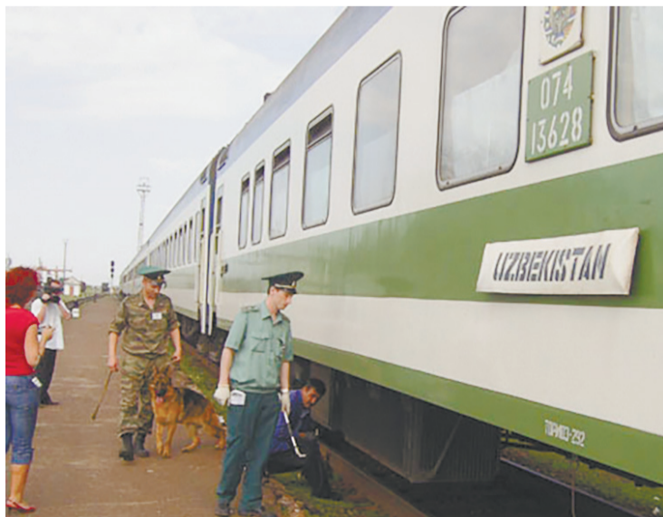
Железнодорожники оценивают техническое состояние поезда.