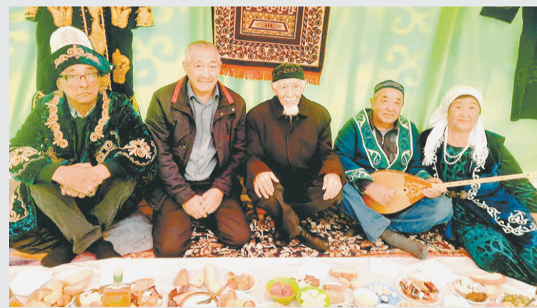
Вот так встречают гостей на казахском подворье!