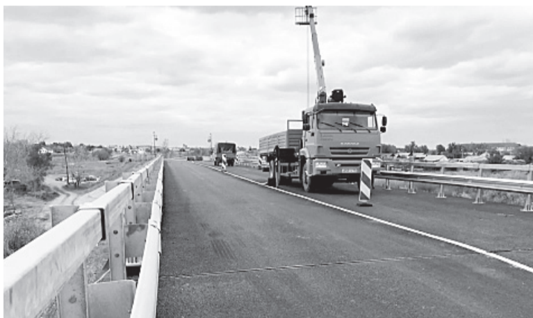
Капремонт на всех запланированных в нынешнем году мостах оренбургские строители успели завершить до снегопадов.

Как уточнили в Главном управлении дорожного хозяйства Оренбургской области (ГУДХОО), эта важная автотрасса входит в региональную опорную сеть, капремонт ее первого участка был в прошлом году. Сейчас она приведена в нормативное состояние практически на всем протяжении – примерно на 120 километрах. Суммарно же в нынешнем году по нацпроекту «БКД» капитально отремонтируют более 300 км областных и муниципальных дорог. Работы на 83 из 89 объектов завершены. По данным регионального министра, итого уложено более 2,7 миллиона квадратных метров дорожного полотна.