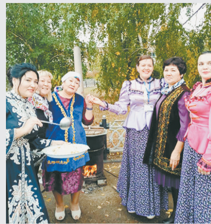
Здесь казахи с русскими рождаются и семьями, и песнями.

Главный мусульманский праздник Курбан-байрам вместе с казахами отмечает вся Курманаевка. Обряд жертвоприношения в честь благополучного окончания зимы пришел из глубины веков, передается из поколения в поколение. Важно в ритуале не только зарезать барана во славу Аллаха, нужно знать, кому и как его мясо подать.