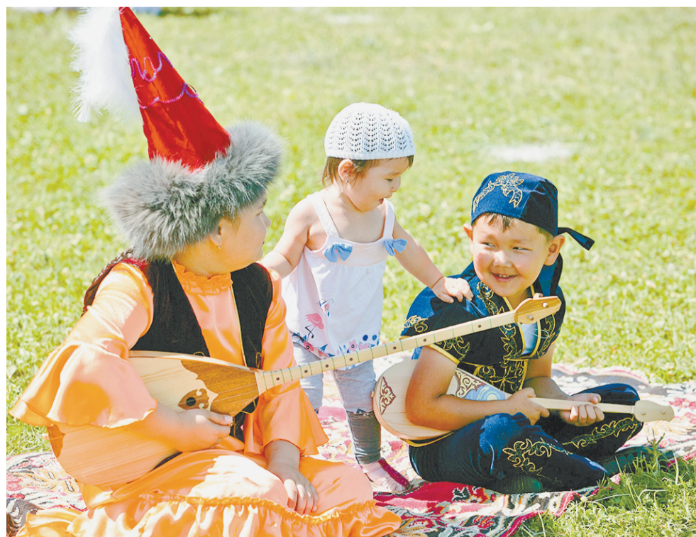
«А ну-ка, спойте мне, акыны!»