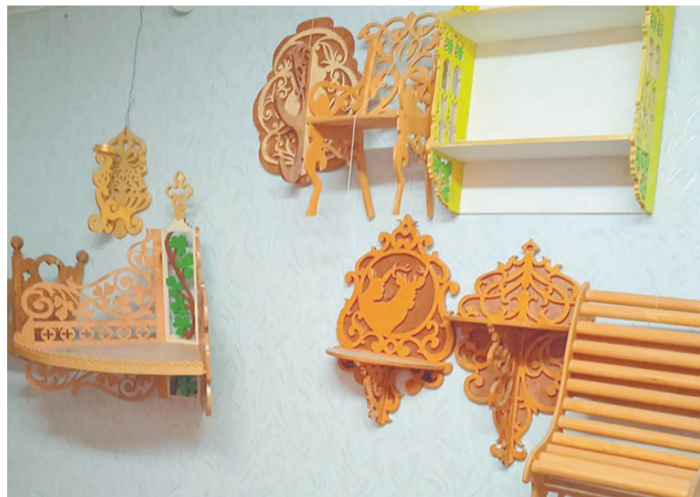
Такие полочки не купить в магазине.

— Деревянные табуреты никогда не выйдут из моды, – уверяет мастер. – Они проч-