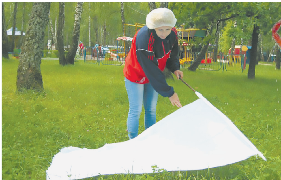
С помощью белой простыни легко обнаружить клещей.

Война с клещами начинается с энтимологического исследования, которое проходит в конце апреля-мае, перед началом сезона активности паразитов.