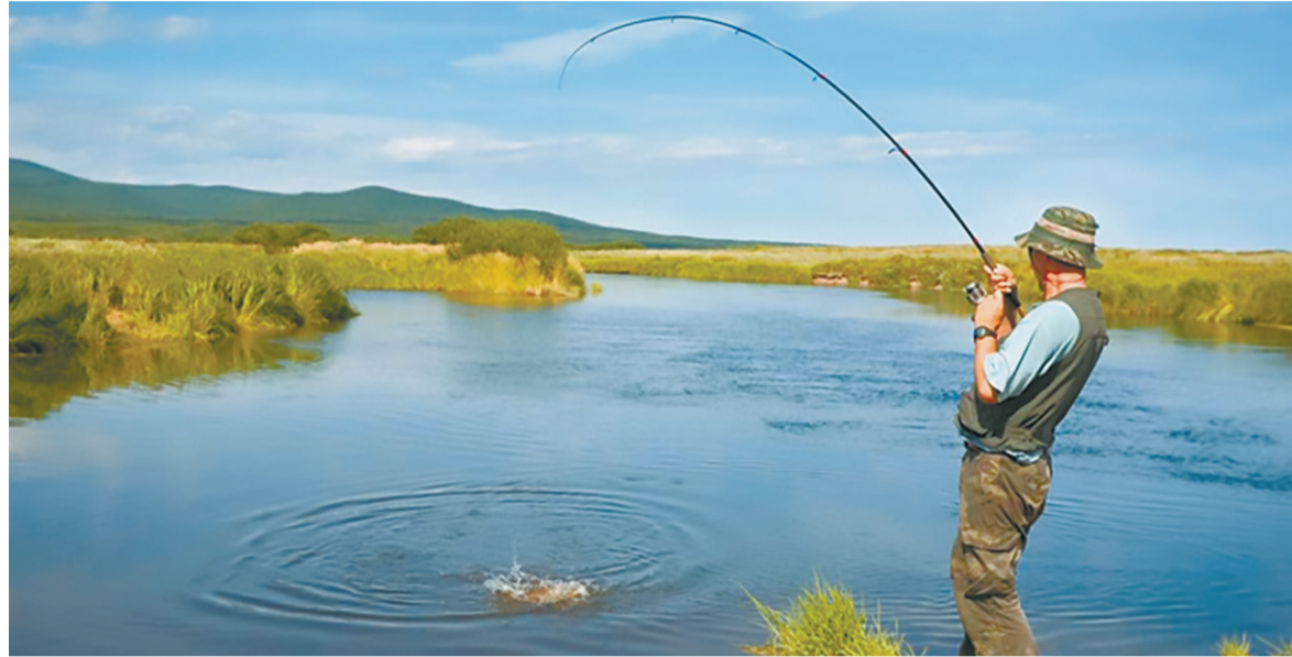
Рыбалка лечит нервы.