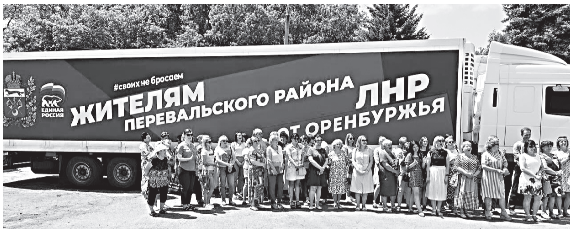
За гуманитарной помощью выстроилась очередь.