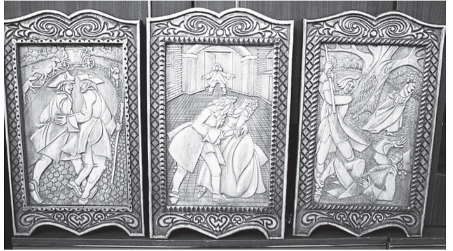
Триптих «Третий лишний» - одна из самых сложных и любимых автором работ.