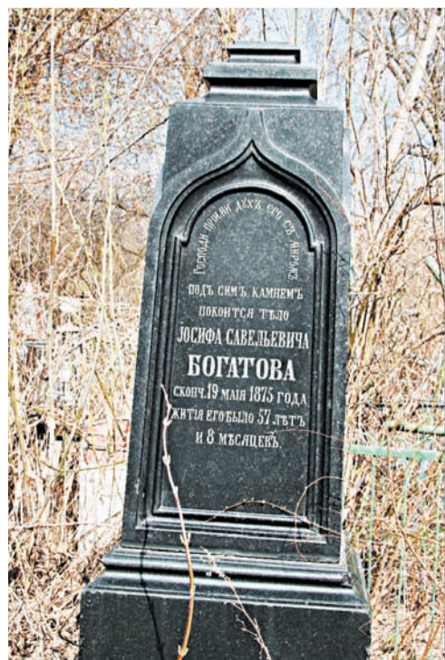
Старые захоронения на бузулукском кладбище.

« Есть могилы безымянные, а есть относящиеся к далекому дореволюционному времени, свидетелей которому уже нет. Но это не останавливает юных краеведов в желании разгадать их тайну.