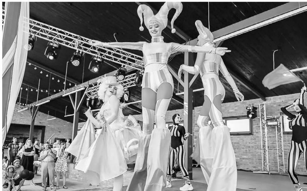
Зажигательное диско никого не оставит равнодушным.