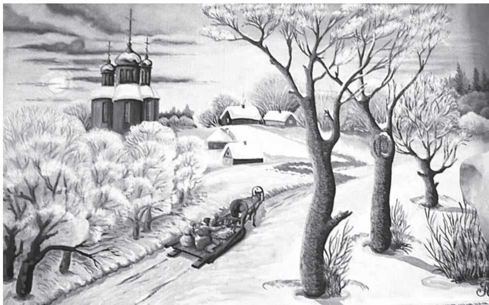
Из живописи художнику особенно удаются пейзажи.