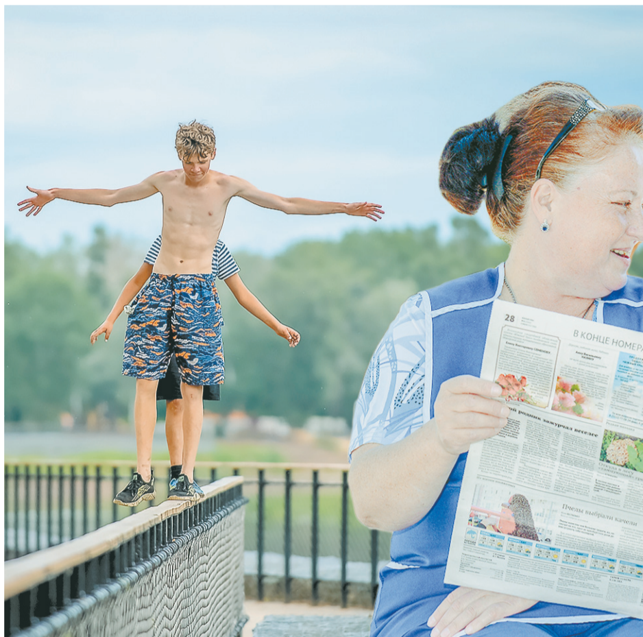
Аттракцион молодецкой ловкости.