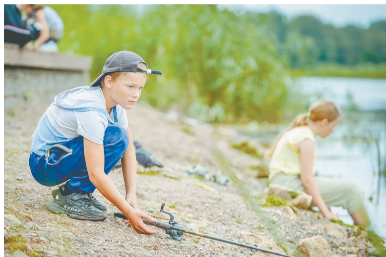
«Где ты, рыбка золотая?»

Торопится молодежь на улицы, в парки и к водоемам порезвиться. Спешат взрослые, спешит малышня, папами и мамами поддерживаемая. Да разве усидишь дома в июле! А если и посидеть, то на лавочке уличной куда приятнее, интереснее, впечатлительнее... И июль-торопыжка, но всяким днем нас одаривает. Наслаждаемся, интересуемся, впечатляемся!