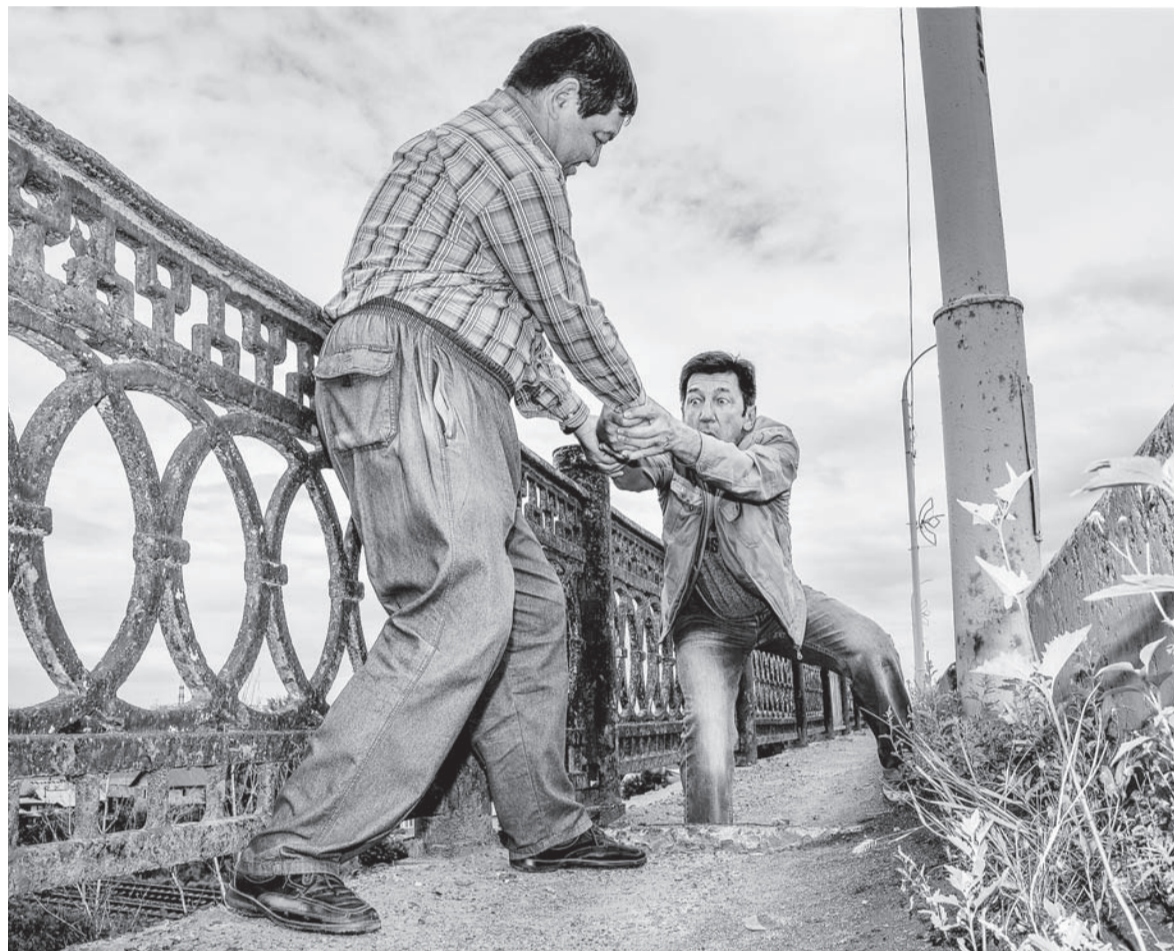
На «донгузском» мосту в плитах отверстия под столбы прямоугольного профиля, а круглые туда не влезли... А для пешехода это опасная ловушка.

Пешеходная часть на мосту отделена от автомобильной мощными бетонными плитами. И эти конструкции накренились так, что склоняются под ноги идущим, сужая без того стесненный путь да еще и угрожая выпирающими металлическими прутьями. Пробираемся меж штырей, тут новые ловуш-