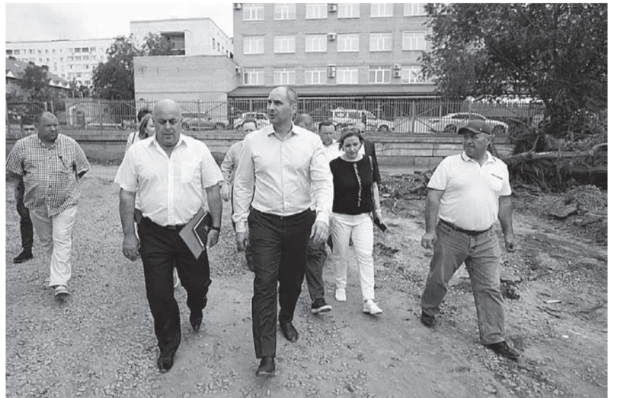
Денис Паслер на площадке «Атриума».

Второй этап благоустройства идет в парке «Березка». На огромной территории – 938,8 тысячи кв. метров – должны обустроить пешеходно-тропиночную сеть, площадки для отдыха и детскую игровую зону, устано-