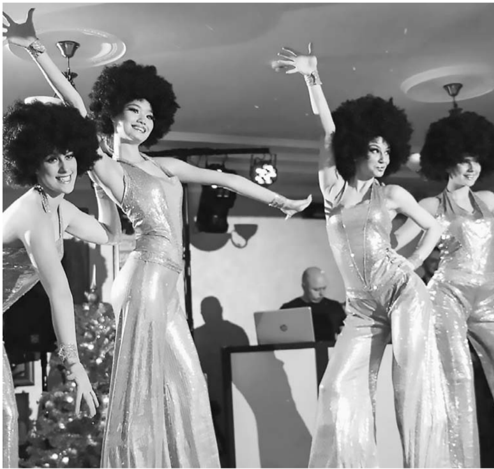
Артисты на ходулях вызывают восхищение как у малышей, так и у взрослых.