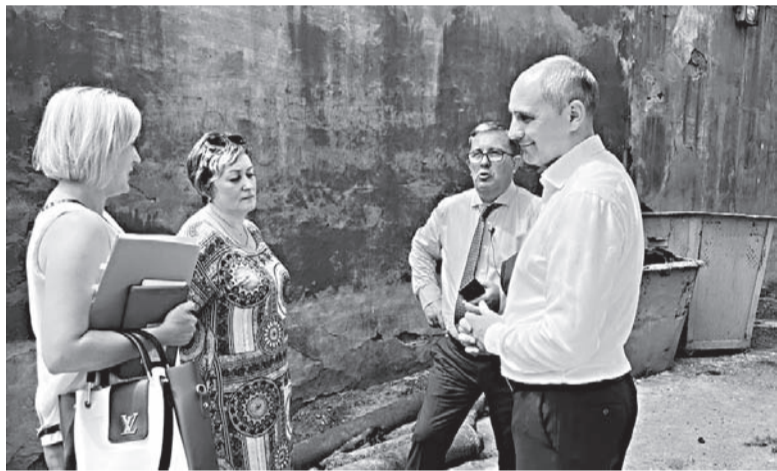
Местные жители рассказали Денису Паслеру, какая помощь им нужна.

Работу в Перевальском районе начнут с восстановления социальных объектов. В ближайшее время ожидается ремонт гимназия № 1 Перевальска. Приведут в порядок кровлю, фасад, канализацию, спортивный зал, поменяют окна. В детскую школу искусств передадут новые музыкальные инструменты. Здесь тоже обновят фасад и займутся прилегающей территорией. Пять детских садов и школ ждет благоустройство дворов.