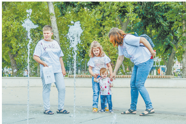
У кого фонтанчик выше?