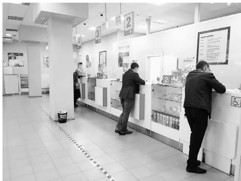
Оренбургская почта расширяет спектр услуг, внедряет новые технологии, повышает уровень почтового сервиса и остается одним из главных мест общения для жителей Оренбуржья.

- В нескольких регионах небольшие посылки в тестовом режиме уже начали доставлять роботы. Как это работает? Сотрудники отделения загружают посылку в робота, после чего он отправляется по указанному пользователем адресу. Клиент получит об этом push-уведомление и сможет отследить в мобильном приложении оставшееся время до прибытия робота, посмотреть его местоположение на карте. Когда тот окажется на месте, придет push-уведомление и SMS с кодом, который нужно будет ввести в приложении. Машина откроет крышку, и посылку можно забрать. Этот пилотный проект реализуется совместно с компанией «Яндекс» в некоторых отделениях Московской и Ленинградской областей, а также в Татарстане. Но живое общение с почтальоном-человеком незаменимо. Ведь у нас работают замечательные люди, душой и сердцем преданные своей профессии. Они в любую погоду приносят людям письма, посылки, прессу, денежные выплаты, товары первой необходимости, принимают плату за коммунальные услуги, оформляют подписку на любимые издания, иногда выступают и в роли психологов.