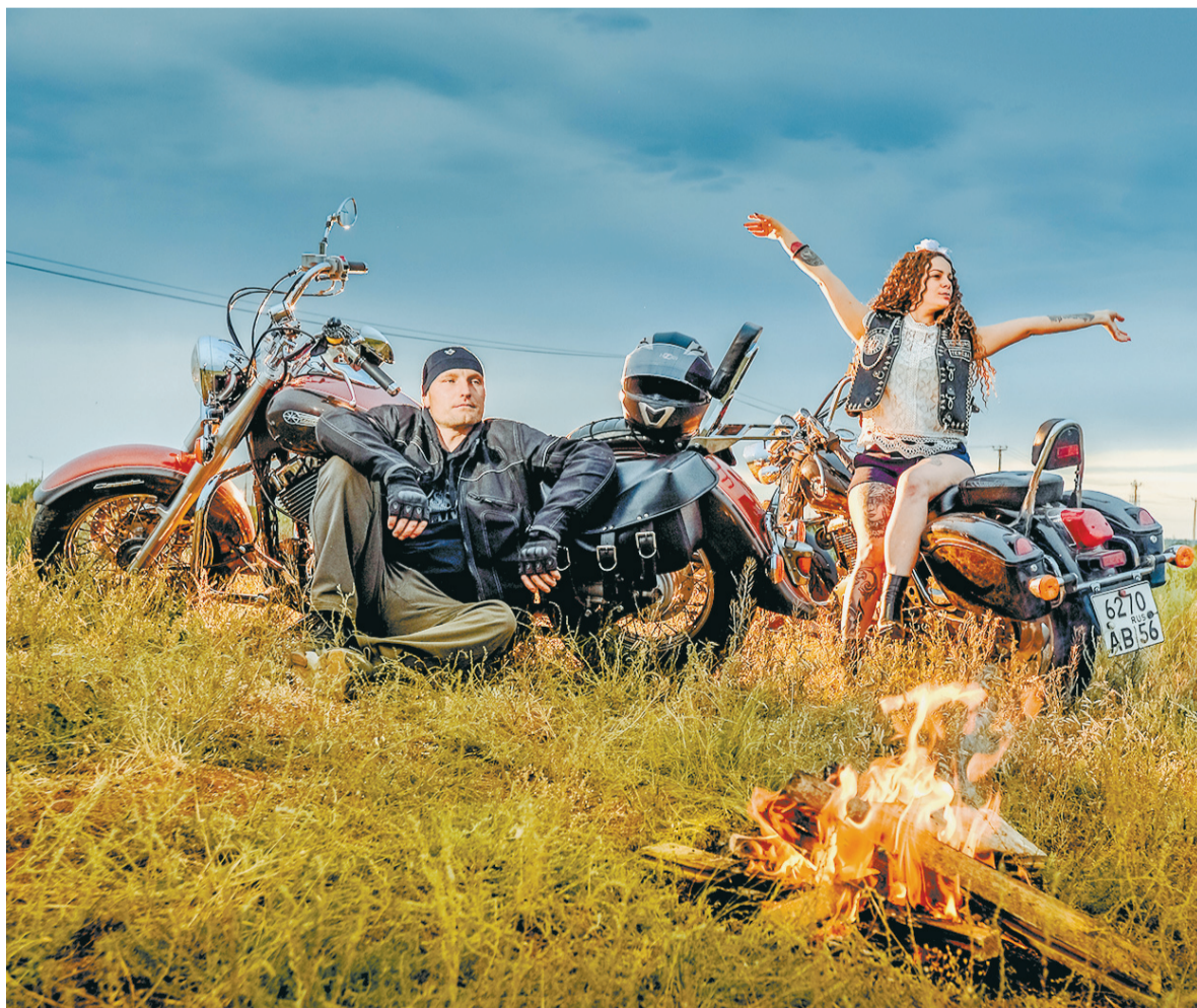
Сбылись мечты байкерские!