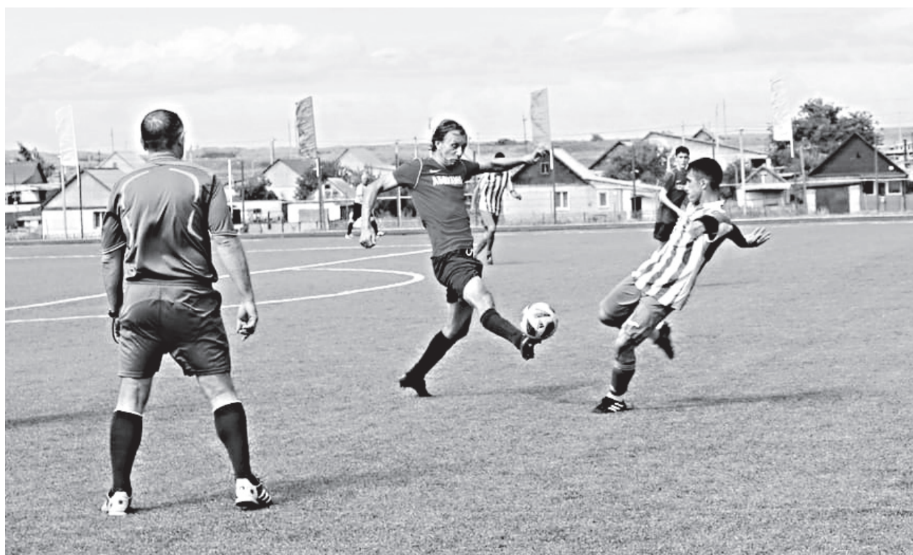
В финале команда «Абдулино» уступила сборной Оренбургского района всего одно очко.

(23 тысячи человек и выше) 1-е место - Оренбургский район, 2-е - Новосергиевский район, 3-е место - Соль-Илецкий городской округ.