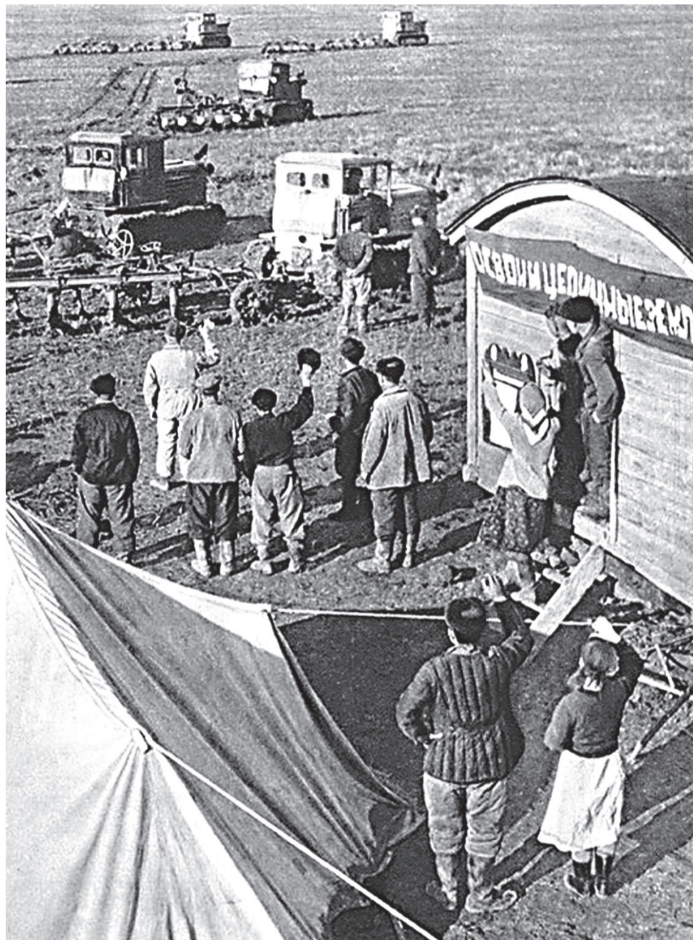
Прибывшие на освоение целины комсомольцы на условия быта не жаловались.

Но вот что интересно... Зерна, значит, не хватало? А в том же номере газеты за 1 апреля 1954-го - постановление Совета Министров СССР и ЦК КПСС «О новом снижении государственных розничных цен на продовольственные и промышленные товары». Хлеб пшеничный предписывалось удешевить на 5 процентов, ржаной - на 8. И далее - длинный список: платья, блузки и дру-