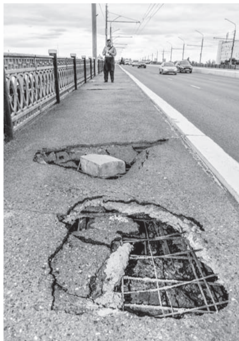
Стоп, впереди провалы!

Путепровод на улице Терешковой (с пересечением улицы Шевченко) поначалу нам приглянулся. Кстати, там большая реконструкция завершилась в конце прошлого лета, так что года еще не прошло. Отремонтированному объекту тоже массовые комиссии добро дали, пустили в эксплуатацию.