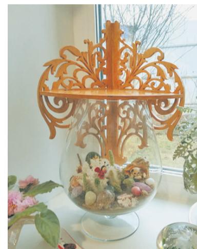
Резные подставки станут украшением любого дома.

ные, а значит, надежные. Современные, с тонкими металлическими ножками-трубками, столько не прослужат. Мастерю свои табуреты без единого гвоздя, использую клей и иногда фиксирую шурупами, если без них не обойтись.