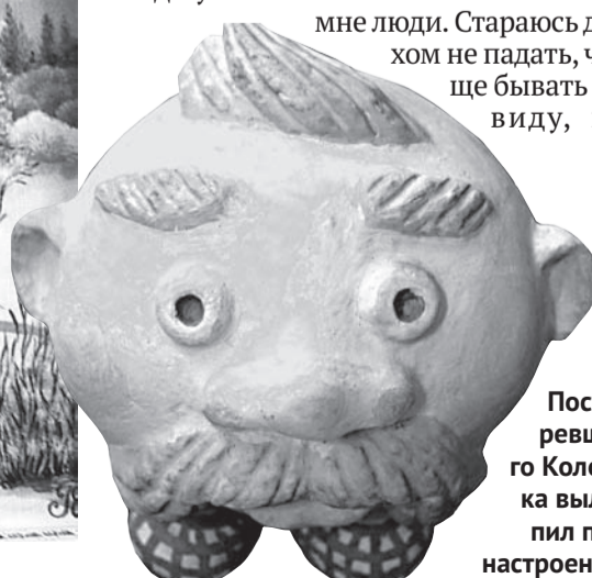
Поставшего Колобка вылепил под настроение.