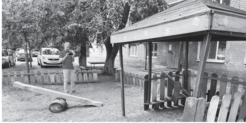
Каждой площадке – особое внимание.

- Призываю родителей, бабушек и дедушек не оставаться в стороне от важной акции, сообщать нам о потенциально опасных местах, - обратилась к оренбуржцам региональный уполномоченный по правам ребенка Анжелика Линькова.