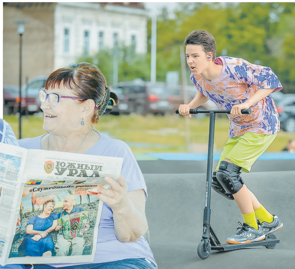
Куда хочу, туда качу!