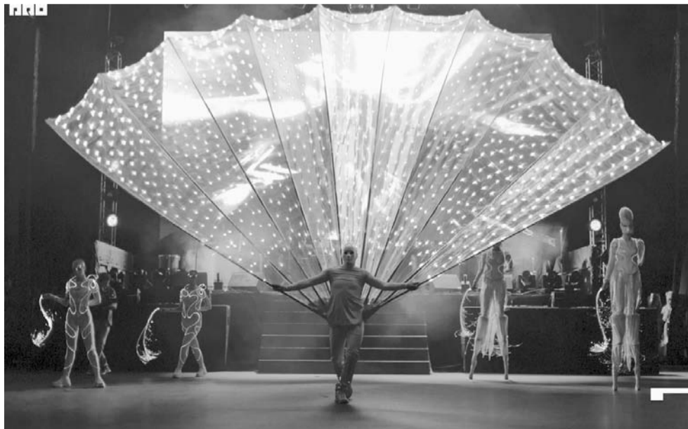
Световое шоу «The Greatest» - новый проект продюсерского центра «Сарафан групп».

- Наша цель - сделать человека счастливым, а понятие о счастье у каждого свое, особенное. Потому и программа пишется для каждого заказчика индивидуальная, - объясняет Евгения.