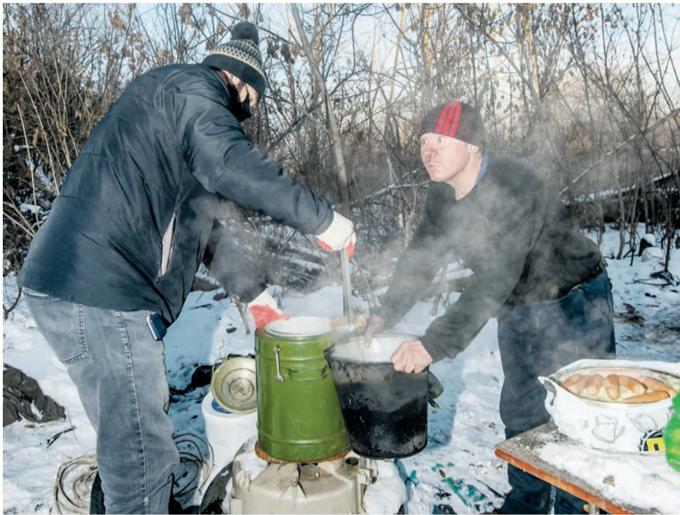
Помощи волонтеров бездомные всегда рады.

Крупная симпатичная Люська - не самая тощая дворняга из тех, что бродят по оренбургским улицам. И как ни странно,