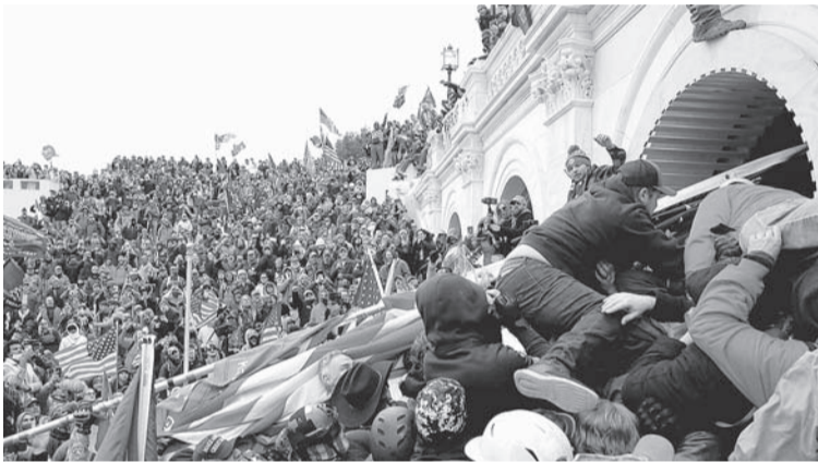
Штурм Капитолия. Такого Америка еще не видела.

Минувшая неделя выдалась относительно спокойной для российского здравоохранения. Ежесуточное количество заразившихся ковидом в стране составляло примерно на 5 тысяч человек меньше, чем до новогодних праздников. К тому же массовая вакцинация населения начала набирать обороты: по данным отечественного Минздрава, к исходу прошедшей семидневки привились от смертельного коронавируса более 1,5 миллиона россиян.