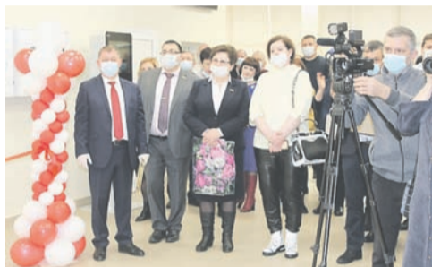
Первые зрители и гости оценили кинотеатр по достоинству.

В Сорочинске после масштабной реконструкции открылся кинотеатр «Россия». Теперь благодаря новому оборудованию местные зрители получили возможность одновременно с жителями столиц и областных центров смотреть премьеры российских фильмов.