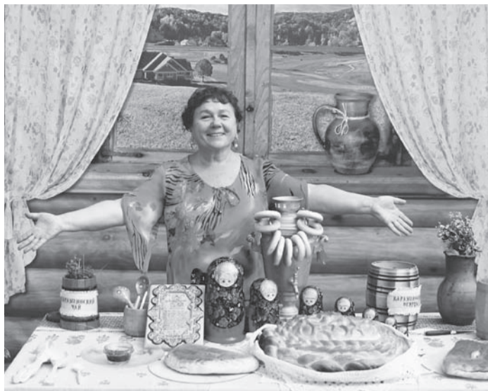
Люблю все праздники!