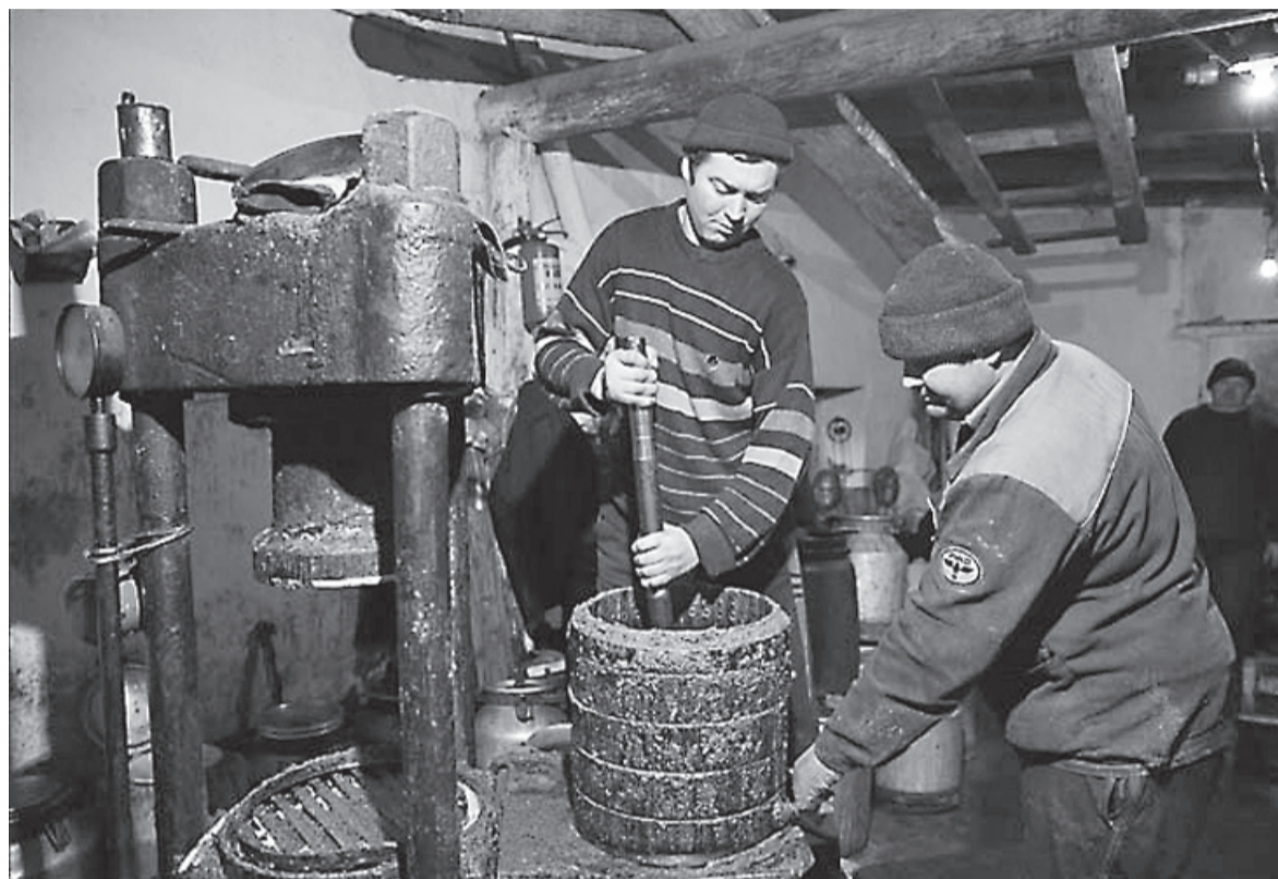
Натуральные сельские маслобойни выдавали продукты изумительного качества.

ко вместе отмечали праздники, а летом совершали выезды на природу.