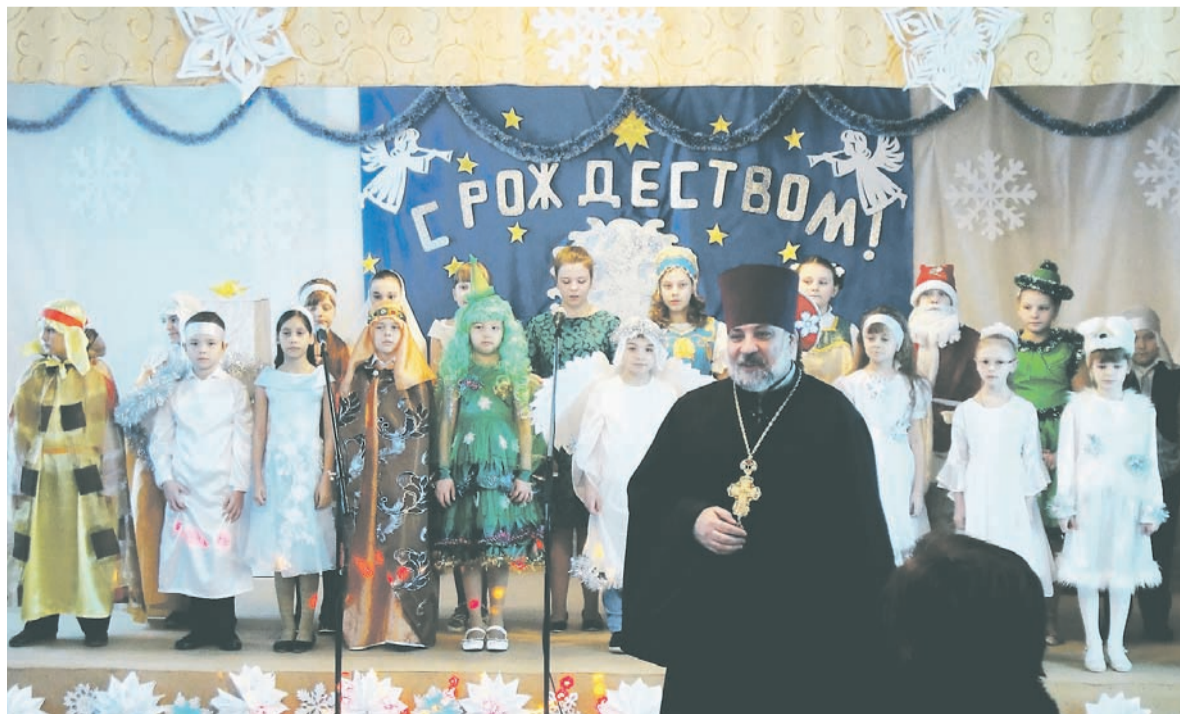
Таким хранят праздник Рождества фотографии в альбоме.

– Это не значит, что душа не должна возрадоваться рождению Христа, праздник всегда с нами, – говорит батюшка. – Главное – верить!