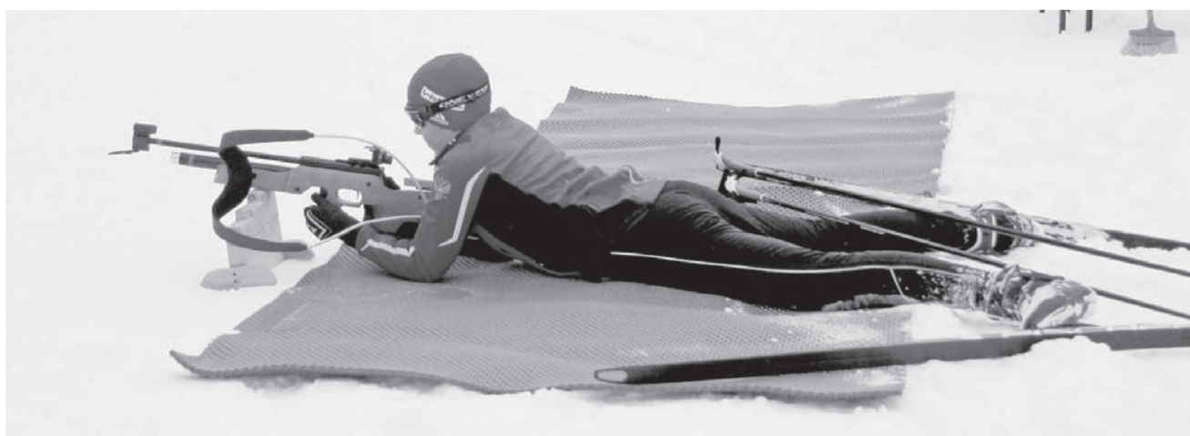
С оснащением инвентарем команде помогли родители ребят.