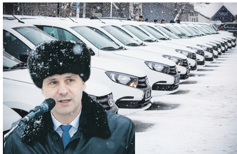
Губернатор вручил главным врачам ключи от новых автомобилей.

- Область нуждается в строительстве новых объектов, в реконструкции многих имеющихся. В прошлом году мы построили восемь новых ФАПов, в этом продолжим работу. Первичное звено